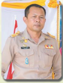
เจ้าเอกฉนิชกฤศ ตันทัพไทย หัวหน้าสำนักปลัด