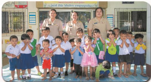
ศพด.บ้านพลไฉ