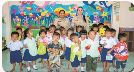
ศพด.บ้านคุ้ม