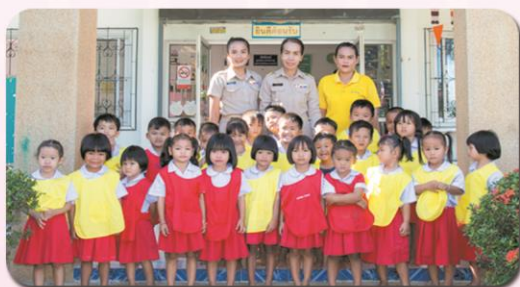
ศพด.บ้านลำโรง