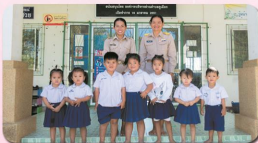
ศพด.บ้านคูเมือง