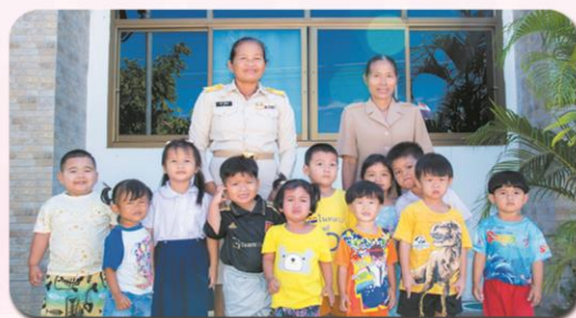
ศพด.บ้านขาม