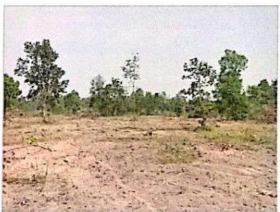
สภาพพื้นที่สาธารณะประโยชน์บ้านคูเมือง ซึ่งมีเนื้อที่ประมาณ 300 ไร่ ซึ่งกรมวิชาการเกษตรของใช้พื้นที่ สำหรับจัดตั้งเป็นศูนย์วิจัยพืชไร่ จ.ยโสธร กำลังมีการปรับพื้นที่และขุดถอนรากไม้