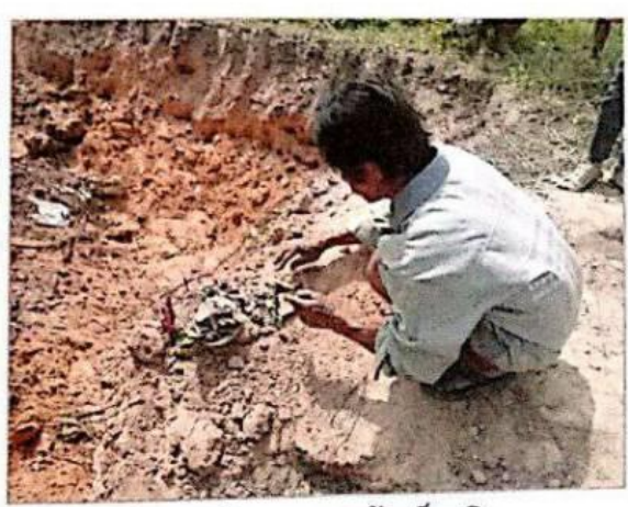
ชาวบ้านในพื้นที่ทราบข่าวการขุดพบโบราณวัตถุ ต่างมาเดินทางมาดูข้อเท็จจริง และจัดรูปของโซคลาภจากบรรพบุรุษในอดีต